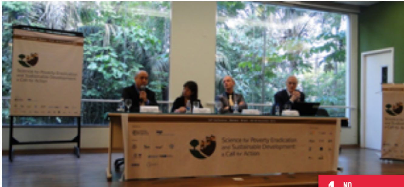
IAP-SPEC Conference in Manaus, December 2014