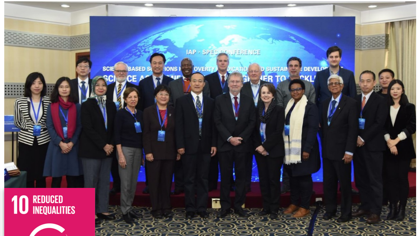
IAP-SPEC Conference in Beijing, December 2017